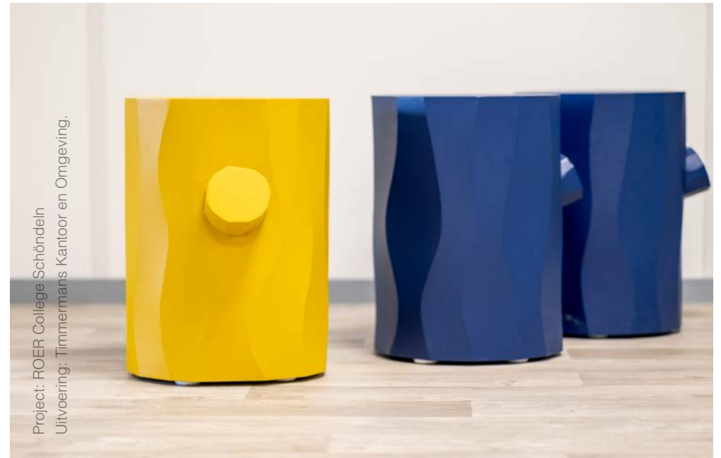
Project: ROER College Schöndeln Uitvoering: Timmermans Kantoor en Omgeving.