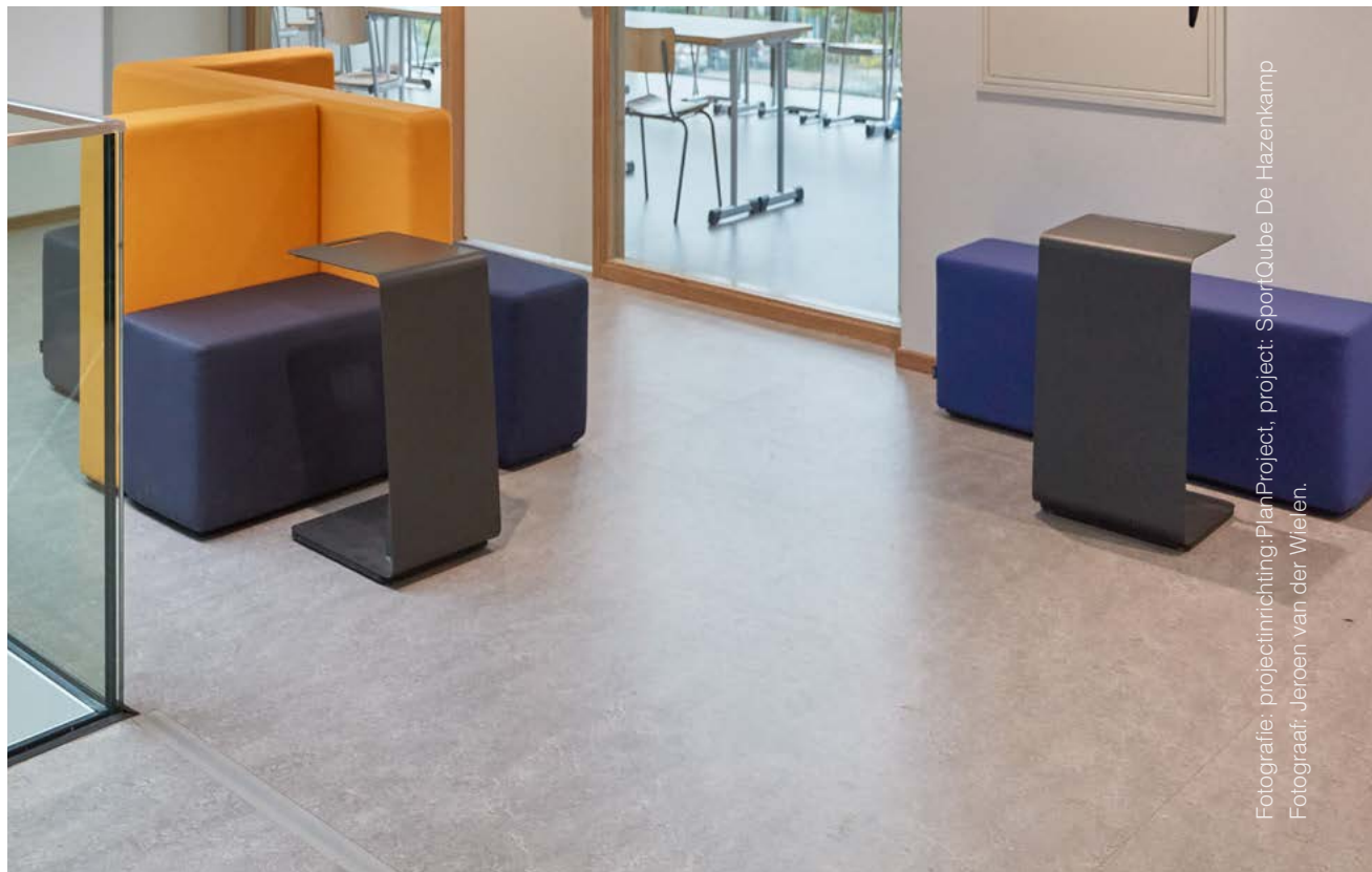
Fotografie: projectinrichting: PlanProject, project: SportCube De Hazenkamp