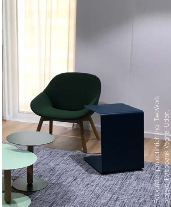
Fotografie: projectinrichting: TwoWork project: Rabobank Veghel-Uden.

Deze bijzettafel schuif je er gemakkelijk bij. Het blad nodigt je uit om met pen en papier te werken, bijvoorbeeld tijdens een brainstormsessie of tijdens de les. Of om op even je laptop op te zetten tijdens een overleg. Maar ook handig als bijzettafel in de kantine op een school.